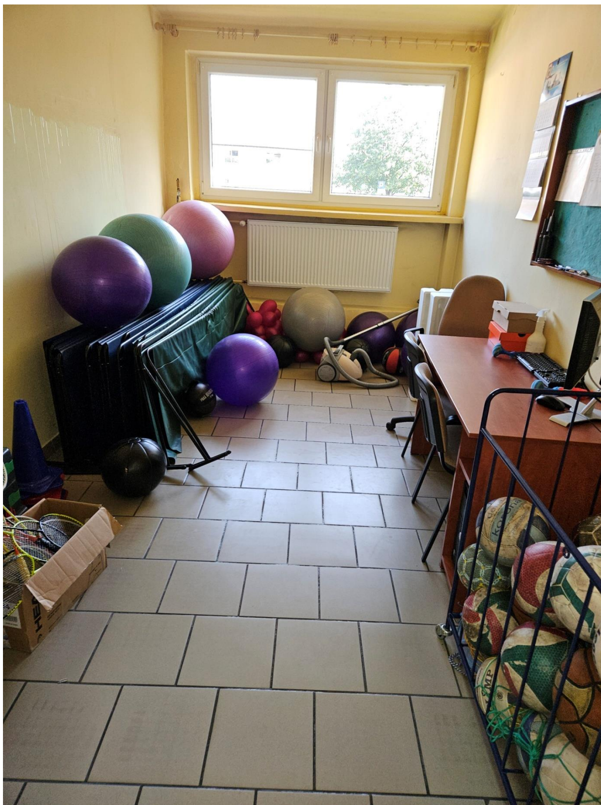
Fot nr 2 – magazyn