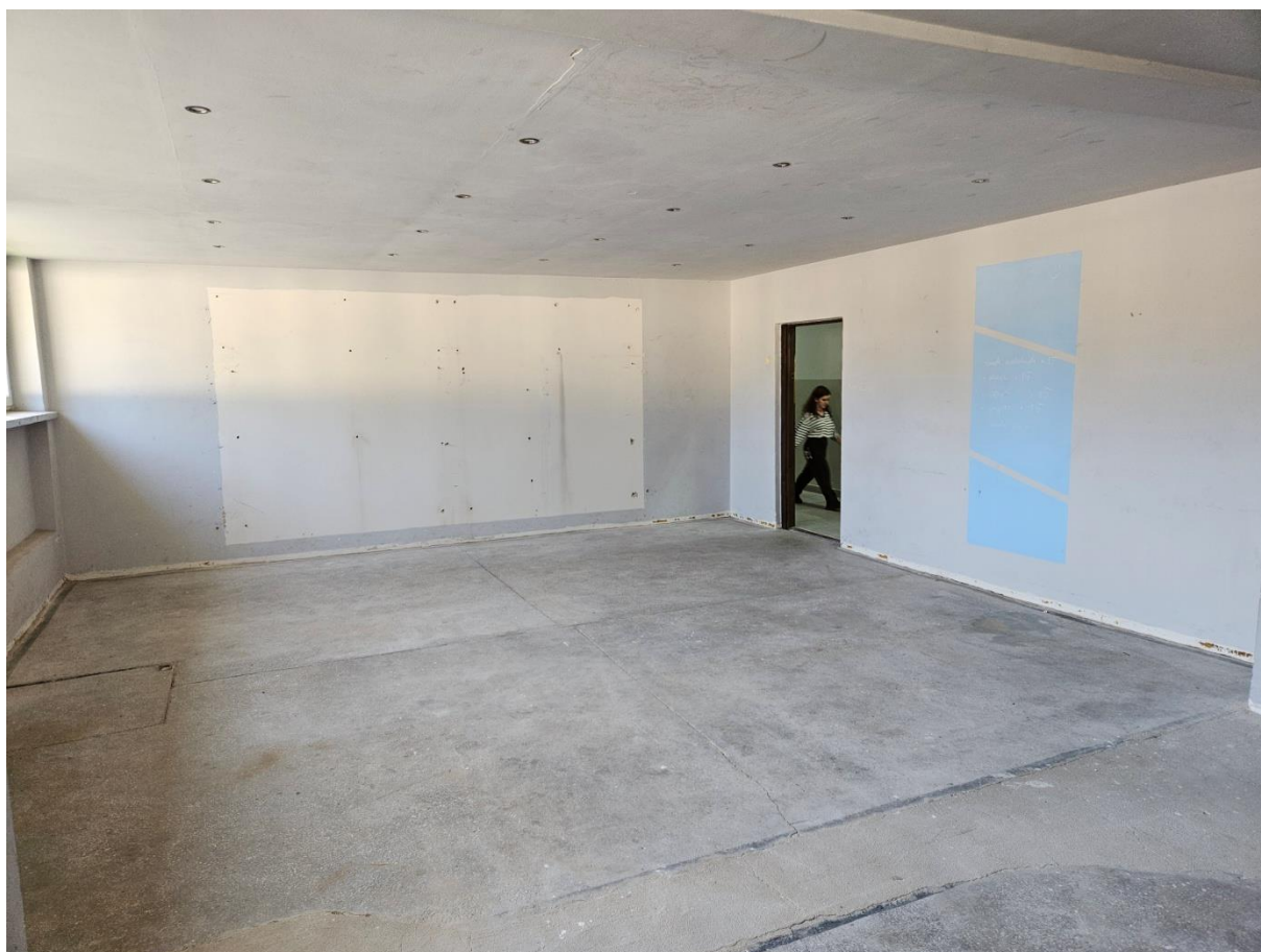
Fot nr 1 – salka docelowej strzelnicy